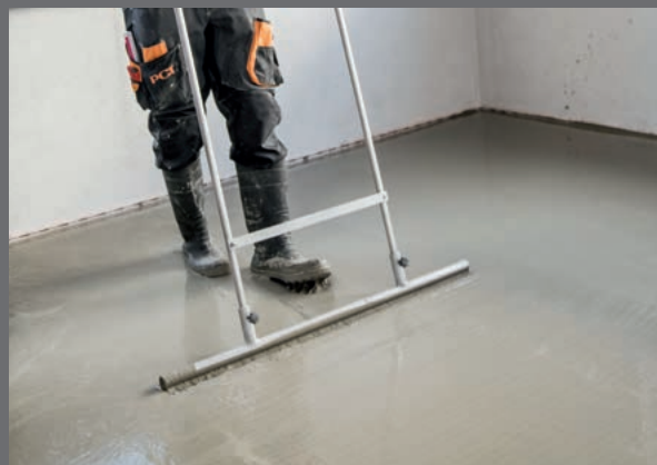
Den stående arbejdsstilling forbedrer det fysiske arbejdsmiljø.