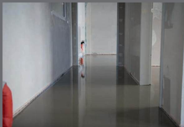
PCI Novoment® Flow er nem at bearbejde med et flot slutresultat.