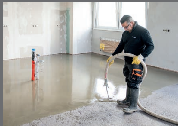
PCI Novoment® Flow kan påføres både manuelt og maskinelt.