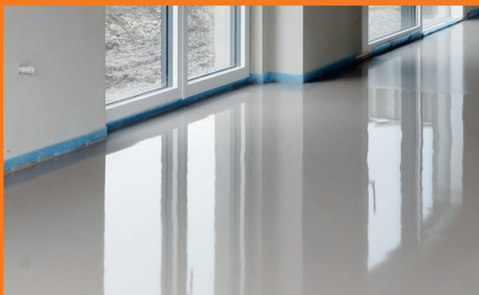
Perfekt resultat: Ingen pin holes, meget glat overflade, som ikke kræver yderligere efterslibning.