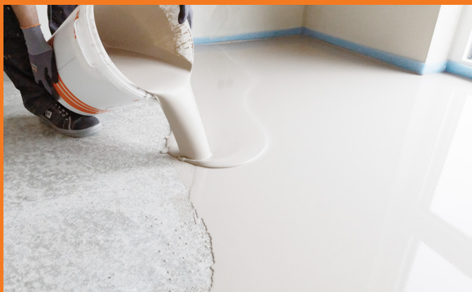
Nemt arbejde: Omrøres – udhældes – nivellerer sig selv!

Den løber og løber og løber: Den nye selvnivellerende spartelmasse PCI Periplan Flow er noget udover det usædvanlige. Takket være dens unikke nivelleringssegenskaber flyder afretningsmassen af sig selv ud i hvert et hjørne – uden yderligere efterbearbejdning og forkorter forarbejdnings tiden. Resultatet taler for sig selv: En spejlglat, overflade – uden anvendelse af pigrulle og uden efterfølgende slibning. Efter ca. 2 timer kan overfladen allerede betrædes og beklædes med fliser eller anden belægning. Kort sagt: Dermed er professionel gulvafretning gjort nemmere hvilket gør produktet tids- og omkostningsbesparende!